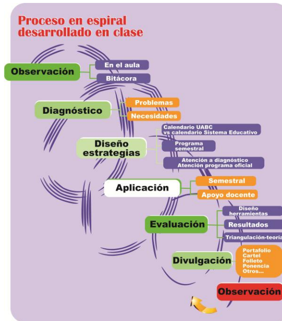
Cuadro 3. Proceso en espiral