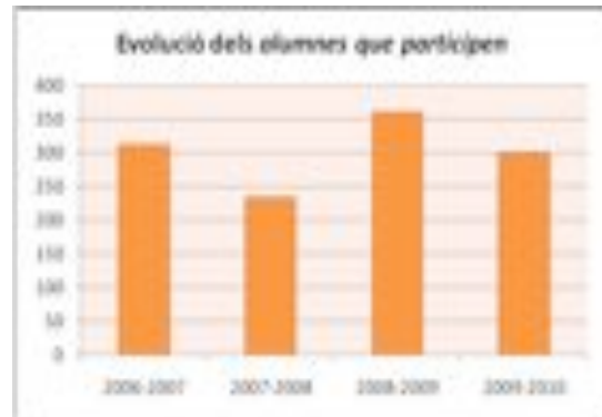
Figura 4: Evolució dels alumnes que participen

Una altra de les dades recollides és la referent a la valoració que fan dels TSTE els JUA. Si ens centrem en el curs 2010-11, observem en el gràfic 2 que les valoracions només es mouen entre la positiva i la molt positiva. En la taula 2 recollim les raons més importants que eludeixen en la participació als tallers.