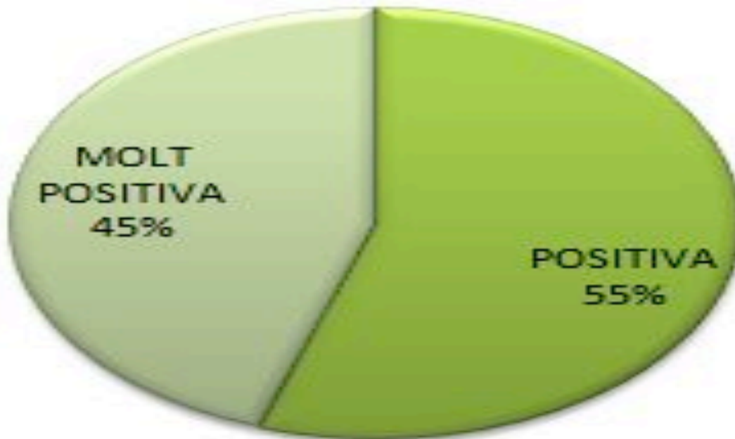
Gràfic 2. Valoració dels TSTE pels JUA