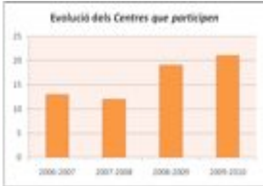
Figura 1: Evolució dels centres que participen als TSTE