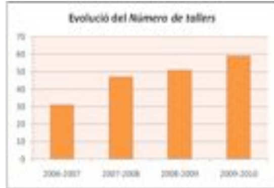
Figura 2: Evolució del nombre de TSTE