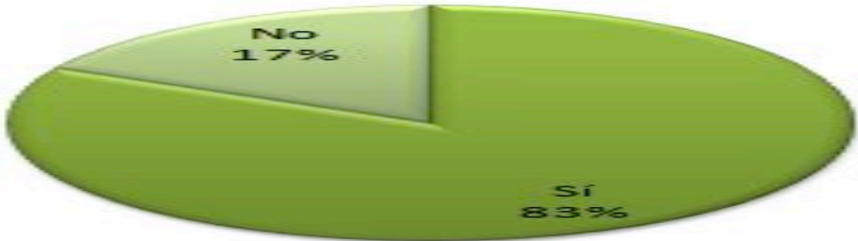
Gràfic 1. T'ajuden les sessions d'assessorament per resoldre els problemes amb què et vas trobant?